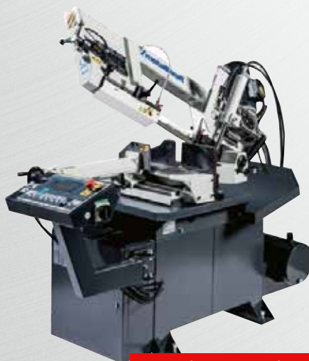
Werkzeuge und Maschinen