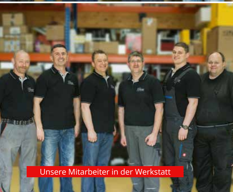
Unsere Mitarbeiter in der Werkstatt